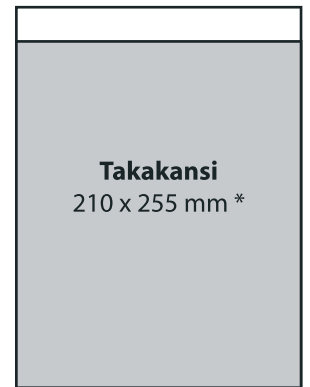
takakansi, 4-väri 1 900 €

* Takakannen yläreunasta 25 mm valkoinen alue koko sivun leveydeltä varattu postin merkintöjä varten.