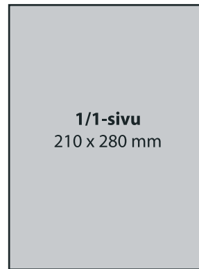
1/1-sivu, 4-väri 1 500 €